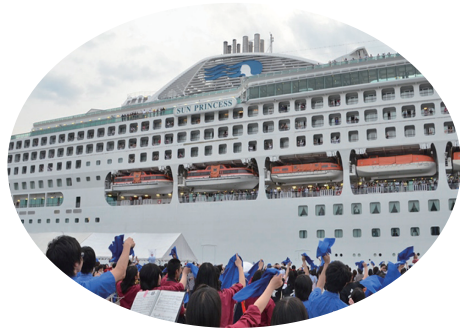
舞鶴港に寄港するクルーズ船

豊かな観光資源、人にやさしいおもてなしの風土など我が国の良さを基にした観光が注目を集めています。特に京都は日本を代表する地域であり、交通インフラ整備も整えられ、観光入込客数は約七八〇〇万人となり、府内観光消費額は約七五〇〇億円にも達しています。