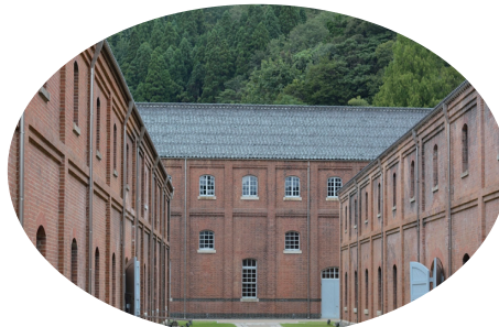
舞鶴市の赤れんがパーク

交流人口を増加させる地域活性化のためには、このグローバル社会・IT社会において自分たちの住む地域を見つめ、再発見した素晴らしい場所やものや人をどのようにして国内外に発信していくかという「情報発信力」が問われることになりま