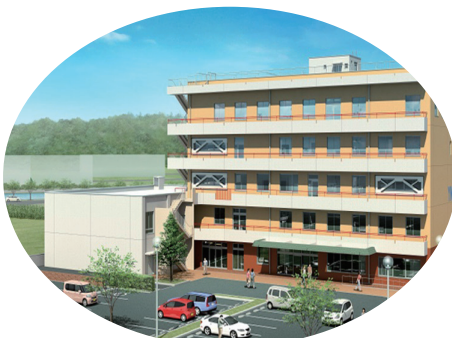
舞鶴校完成予定図

した教育環境を整え、「世界を見つめ、地域に生きる」Think globally, Act Locally」を体現できる青年を育て、地域貢献に寄与することが私たちの使命(ミッション)だと考えます。YMCAが「地域発信力」の推進役としてお役に立てる地域に根差した専門学校となるよう努めてまいります。ご支援よろしくお願いたします。