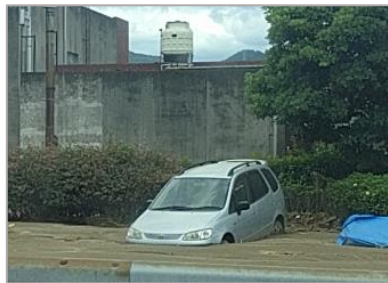
土砂に埋まった車(杷木)