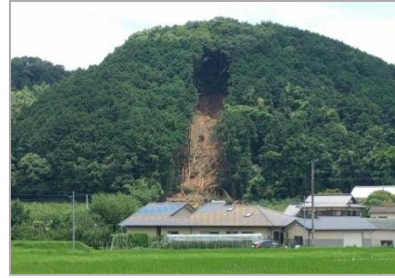
民家裏の山崩れ(朝倉)