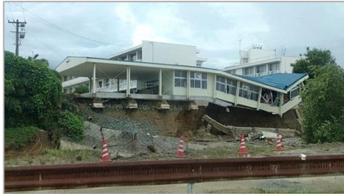
被害を受けた学校施設(朝倉)