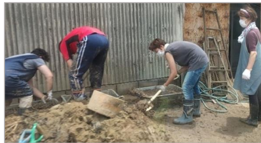
復旧作業をされる住民の方々(杷木)