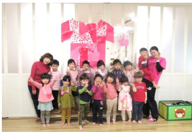
保育園ピンクシャツデー