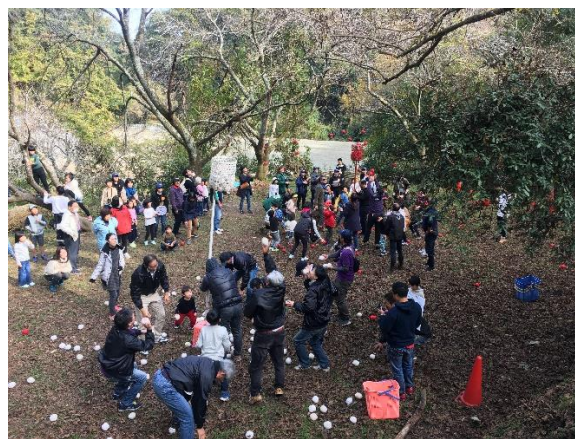
リトリートセンター