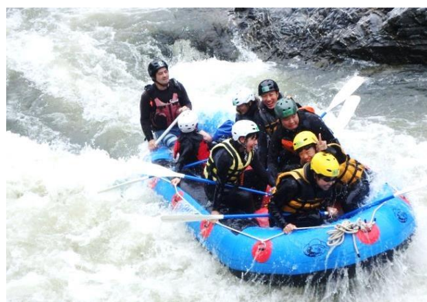
中高生アウトドアクラブ