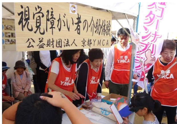
視覚障がい者介助体験コーナー