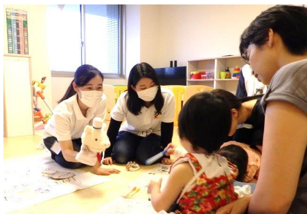
病院訪問プログラム