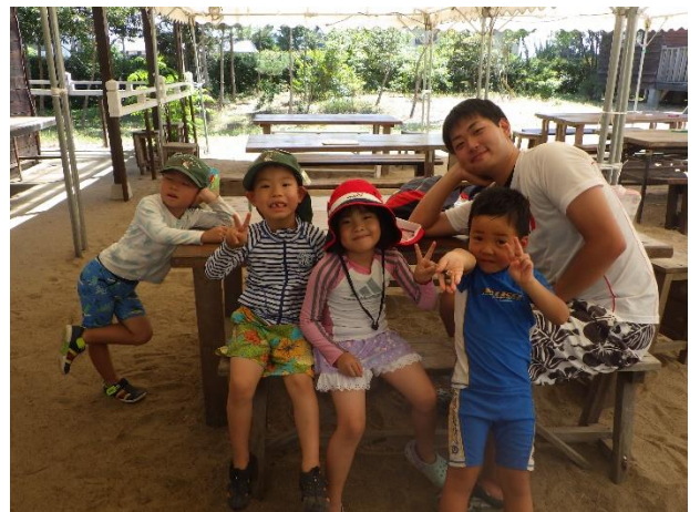
幼児アウトドアクラブ