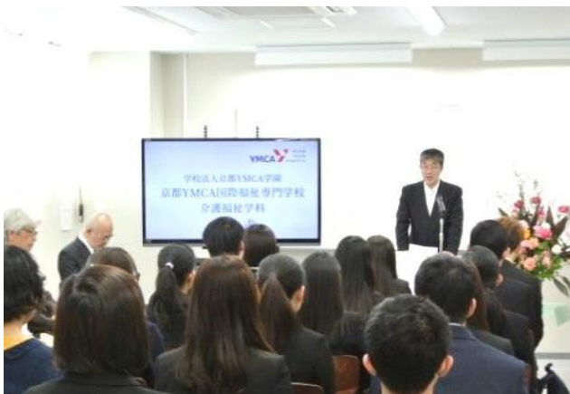
専門学校介護福祉科学科入学式（三条校）