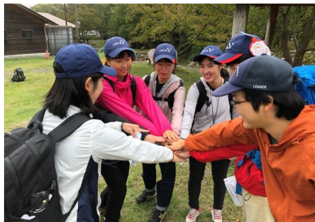
野外リーダートレーニング