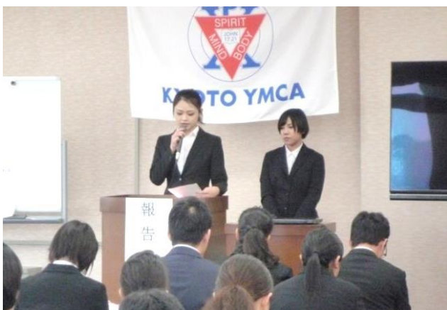
専門学校介護実習報告会（舞鶴校）