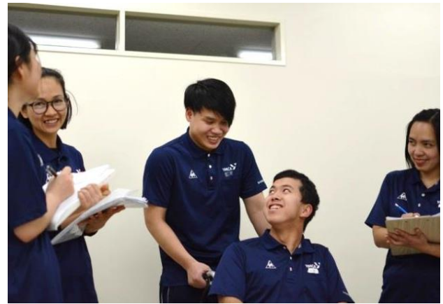
専門学校介護福祉科（三条校）