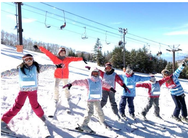
小学生 スキーキャンプ