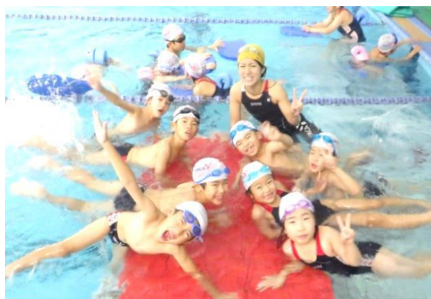
小学生 スイミングスクール