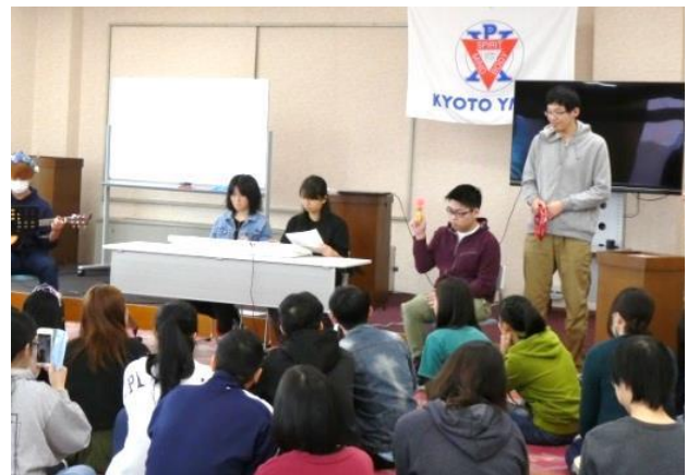
専門学校 YMCA 祭（舞鶴校）