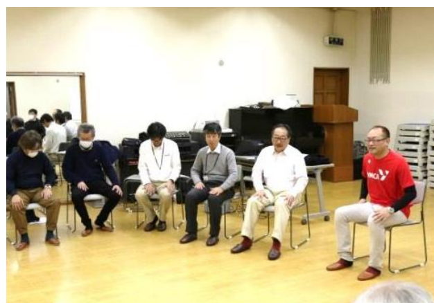
ウェルネスで健康寿命を延ばそう