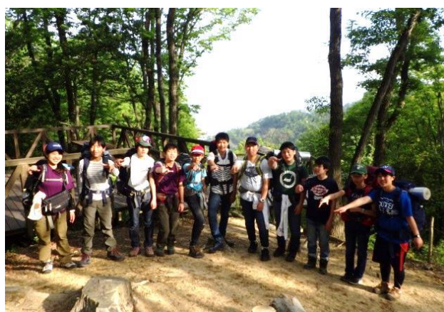
中高生アウトドアクラブ