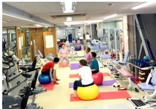
いきいき健康教室