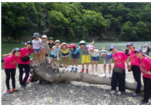
小学生 サマーキャンプ