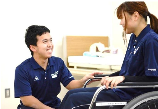
専門学校介護福祉科（三条校）