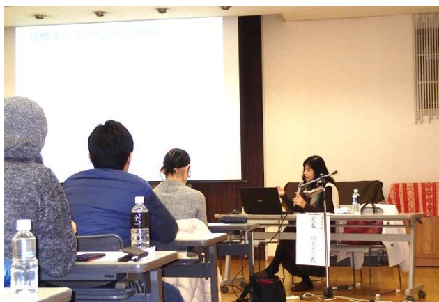
発達障がい児理解セミナー