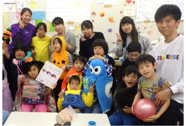
アフタースクール