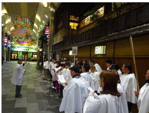
クリスマスキャロリング