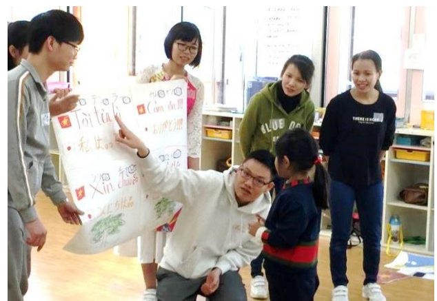
専門学校介護留学生地元幼稚園貢献（舞鶴校）