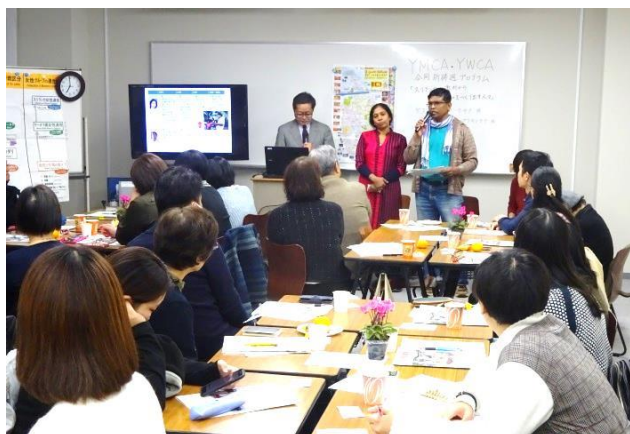
YMCA・YWCA 合同祈禱週集会

YMCAは、広く社会問題を解決するための活動に取り組んでいます。災害支援やいじめの問題を考えるムーブメントづくり、チャリティーイベント。日本、そして世界に広がるネットワークと多様な活動領域を活かして、YMCAがその活動の基盤となり、社会貢献の力を広げていきます。