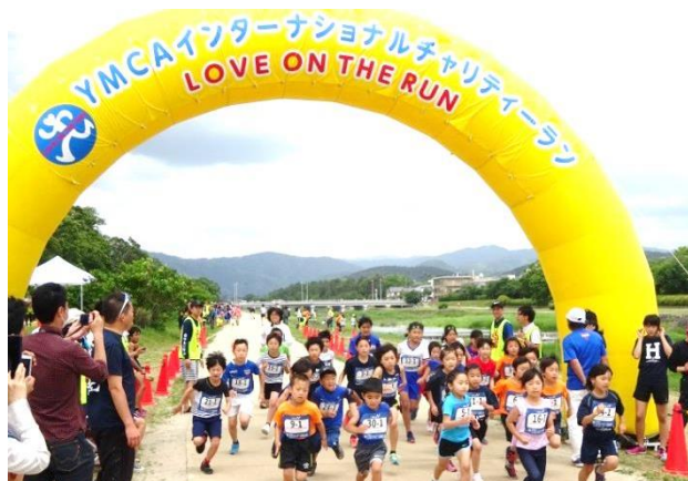
障がいのある子どもたちのための インターナショナルチャリティーラン