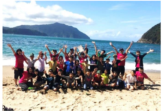
小学生 アウトドアクラブ