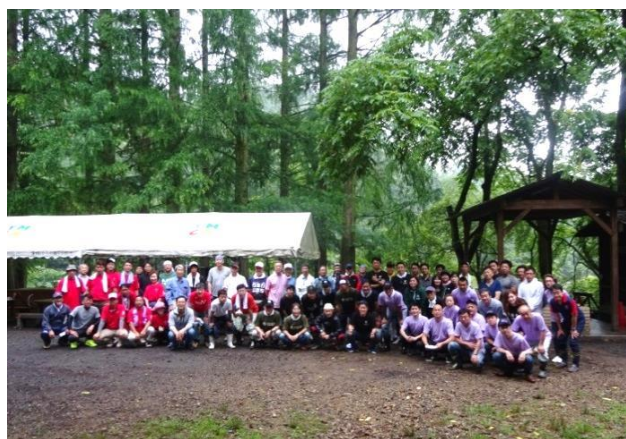
リトリートセンター