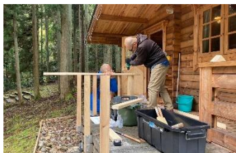
ZEROキャビンのテラスに手摺が！

京都 ZERO ワイズメイズクラブが ZERO キャビンの、京都トウベ-ワイズメイズクラブはグローバルキャビンの、それぞれテラスの刷新ワークを実施！くださいました。感謝！