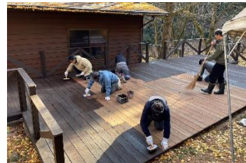
グローバルキャビンのテラス再塗装！

京都 ZERO ワイズメイズクラブが ZERO キャビンの、京都トウベ-ワイズメイズクラブはグローバルキャビンの、それぞれテラスの刷新ワークを実施！くださいました。感謝！